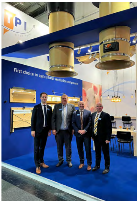
TPI Polytechnik udstillede på EuroTier i Tyskland og VIV i Holland i 2022.