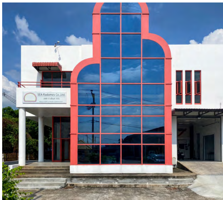
SEA Radomes Co. Ltd., Thailand.