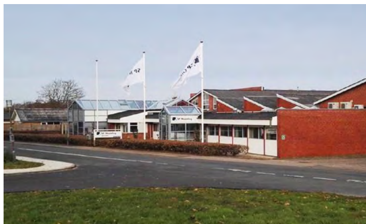
SP Moulding i Stoholm.

I overensstemmelse hermed har selskabet etableret en whistleblowerordning, der gør det muligt for enhver med tilknytning til SP Group på sikker vis at indberette mistanke om manglende overholdelse af SP Groups politikker og retningslinjer, love og regler samt andre alvorlige regelmæssigheder.