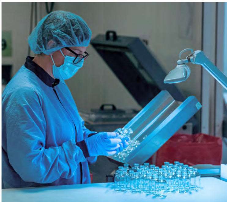
Kvalitetskontrol hos MedicoPack.