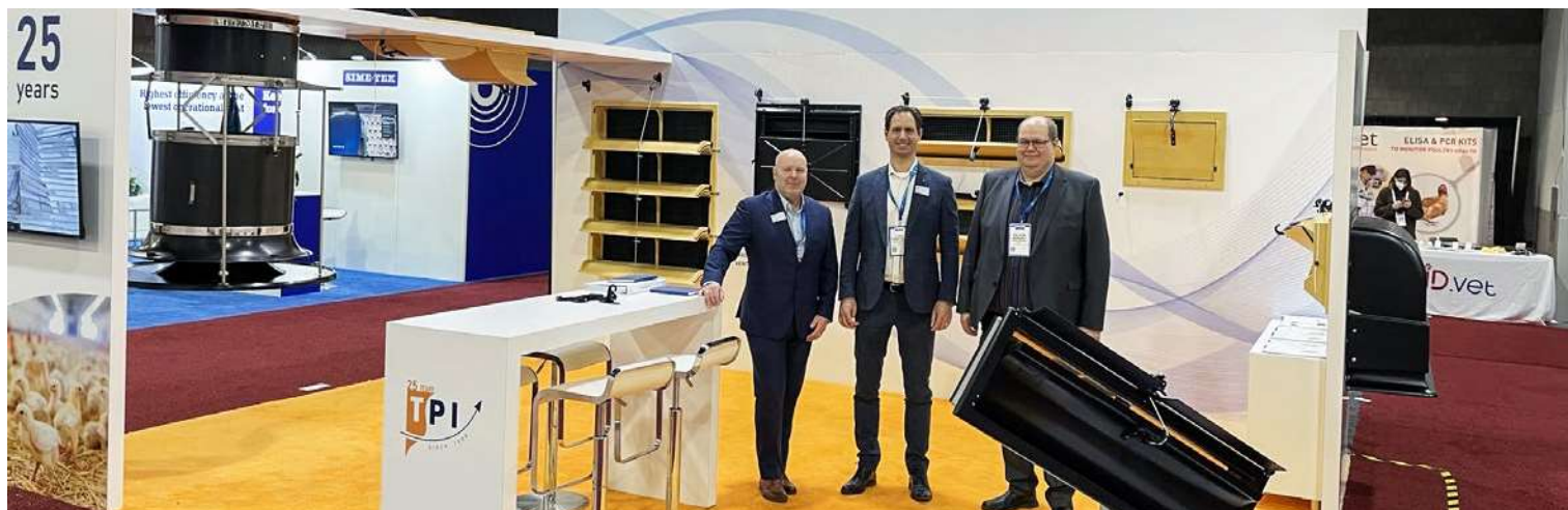
TPI Polytechnieks stand på IPPE messen i Atlanta i januar 2022